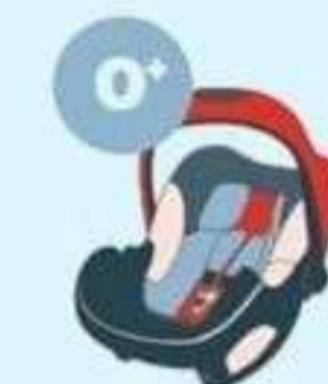
0-13 кг от рождения до 1 года