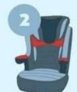
15-25 кг от 3 до 7 лет