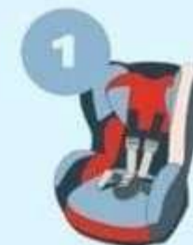
9-18 кг от 9 месяцев до 4 лет