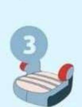
22-36 кг от 6 до 12 лет